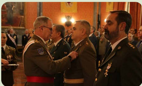
La Pascua Militar en FUTER