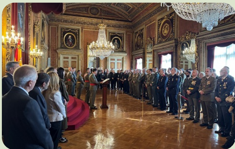
La Pascua Militar en la IGE

Asimismo, la Inspección General del Ejército ( IGE ), con sede en Barcelona, conmemoró esta festividad, en el Palacio de Capitanía General, con un solemne acto presidido por el teniente general Manuel Busquier, Inspector General del Ejército.