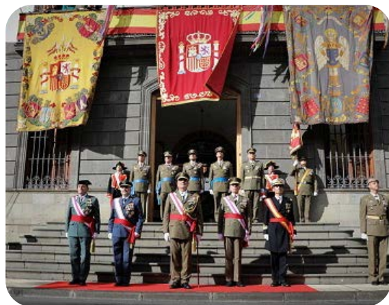
La Pascua Militar en el MCANA